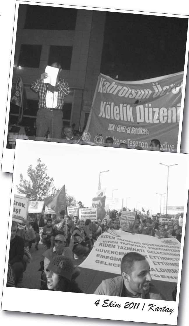
4 Ekim 2011 | Kartal

Eylemde BDSP'liler görsel hazırlıklarıyla dikkat çekti. Yol boyunca BDSP imzalı yazılımlar dikkat çekerken, "Torba yasaya geçit yok" dövizleri, BDSP flamaları taşındı. "Kıdem tazminatı ve haklarımız hedefte... Genel Greve hazırlanalım!" başlıklı bildiriler