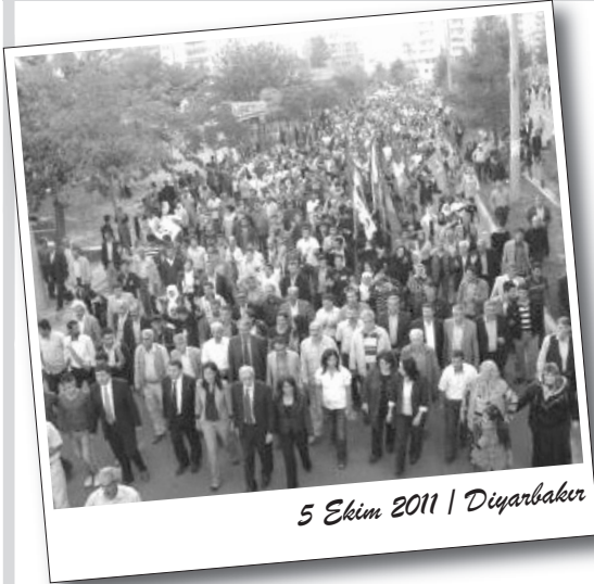
5 Ekim 2011 | Diyarbakır